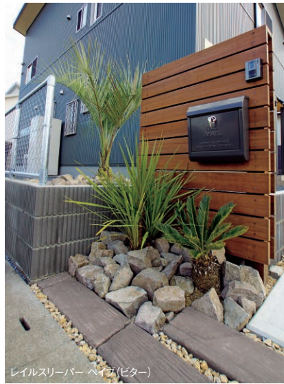
レイルスリーパー ペイブ(ピター)