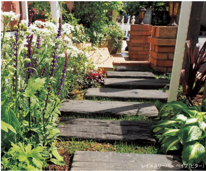
レイルスリーパー ペイブ(ピター)