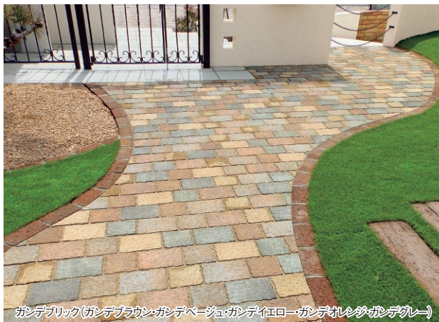
ガンデブリック(ガンデブラウン・ガンデベージュ・ガンデイエロー・ガンデオレンジ・ガンデグレー)