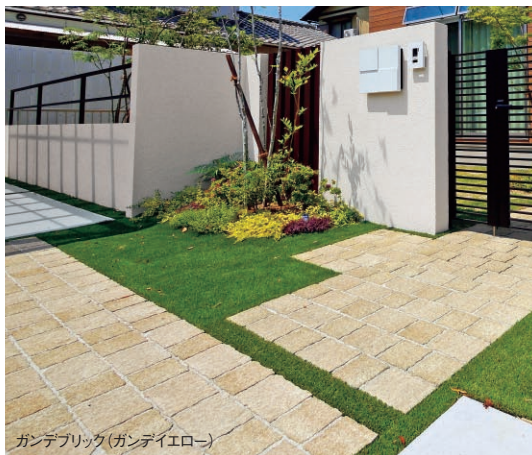
ガンデブリック(ガンデイエロー)