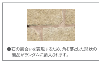
●石の風合いを表現するため、角を落とした形状の商品がランダムに納入されます。