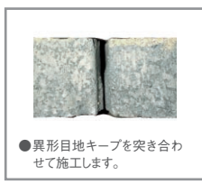
●異形目地キープを突き合わせて施工します。